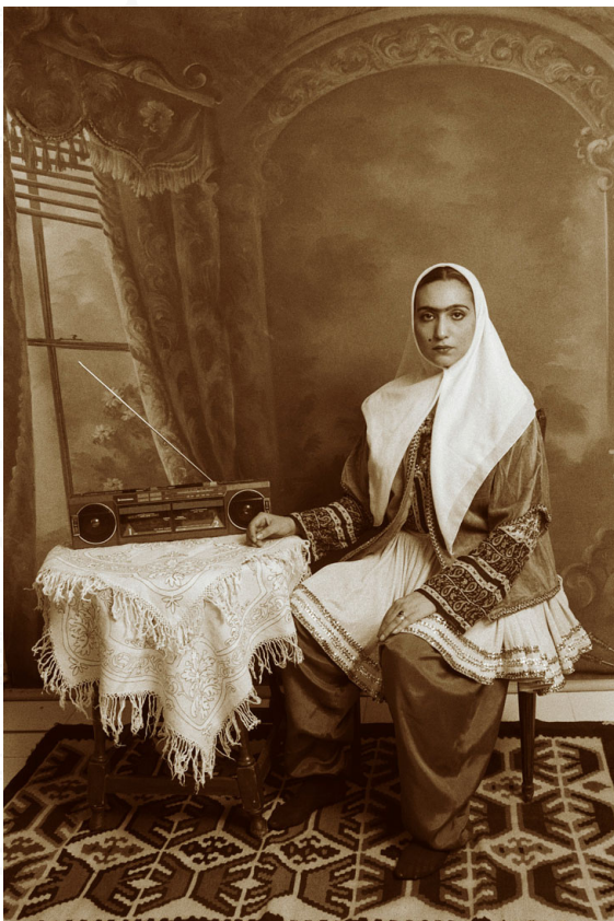
Shadi Ghadirian, Sans titre de la série Ghajar, 1998-1999. C-Impression. 213 x 152 cm

https://www.saatchigallery.com/artist/shadi_ghadirian